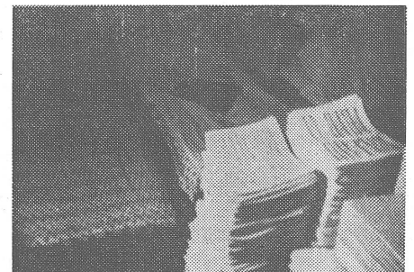
Viel Platz gibt es nicht in den sowjetischen Untergrunddruckereien. Die Teams schlafen und arbeiten im gleichen Raum.

Unter unglaublichen Mühen. Von der Materialbeschaffung an bis zur Verteilung der Druckschriften. Für Grosseinkauf von Papier muss man sich als berechtigt ausweisen. Das war damals möglich, als sich ein Lieferant von der ihm amtlich vorkommenden Abkürzung SZEChB beeindruckt liess und die gewünschte Menge aushändigte. Aber inzwischen ist die Sache bekannter geworden und die Benennung auch. Weil es weitergeht.