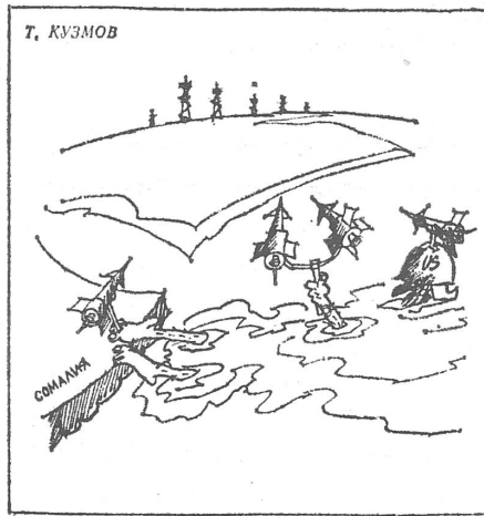
Uncle Sam spielt in seinem Bad an der somalischen Küste mit Raketen («Semedelsko sname», Sofia, 3. 4. 80).

Der somalische Präsident Barre möchte sich we-