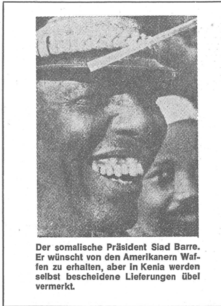
Der somalische Präsident Siad Barre. Er wünscht von den Amerikanern Waffen zu erhalten, aber in Kenia werden selbst bescheidene Lieferungen übel vermerkt.

Noch vor nicht langer Zeit umfassten die ameri-