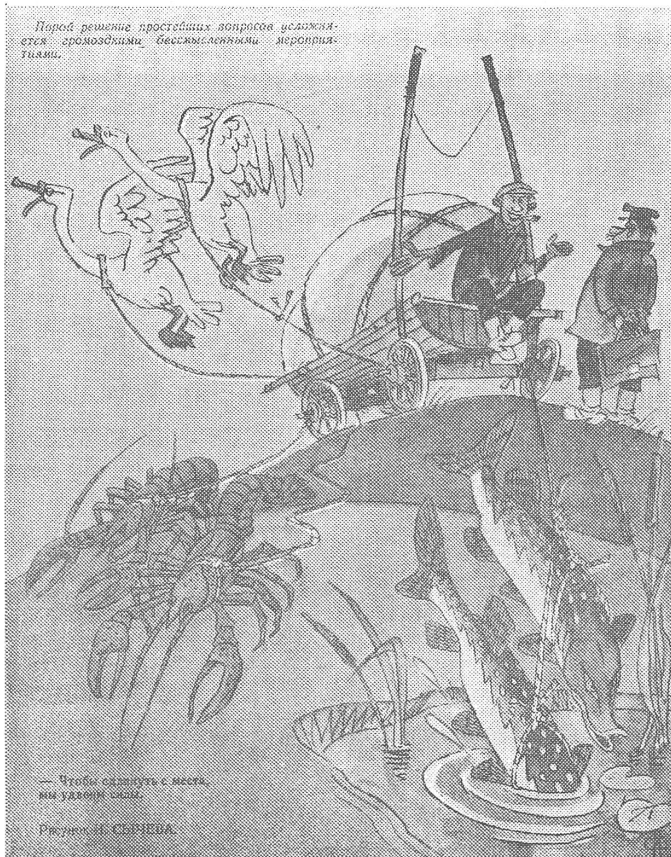
Erst die Belehrung (links oben): «Manchmal wird die Lösung einfachster Fragen durch umständliche, sinnlose Massnahmen kompliziert.» Und dann der Witz: «Um die Fuhr vom Fleck zu kriegen, haben wir unsere Kräfte verdoppelt.» (Nr. 4/80)