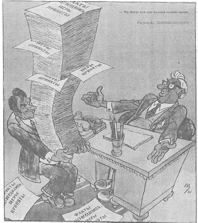
Wer zuständigenorts Reklamationen vorbringt, auf Misstände und Unge- setzlichkeiten hinweist, erhält nach (angeblich) abgeschlossener Unter- suchung ein Formular: «Die Tatsachen haben sich bestätigt; die erforder- lichen Massnahmen sind getroffen worden.» Und im Büro sieht das dann so aus: «So, jetzt reichen die Formulare wieder für eine Zeit.» (Nr. 4/80)