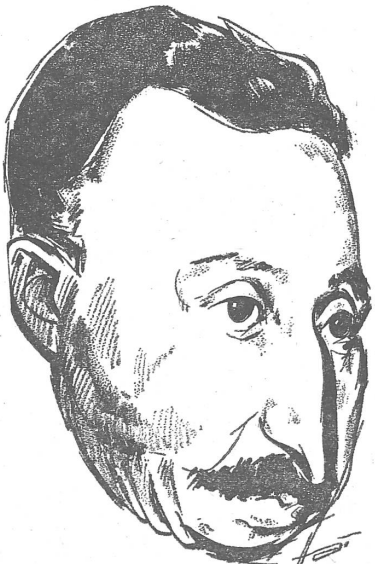
Der chilenische KP-Chef Luis Corvalan. Was er jetzt über Afghanistan sagt, das zeigt, was er damals mit Chile gemeint hat.

Wessen man sich in dieser Hinsicht gerade in Chile selbst zu gewärtigen hat, bescheinigt in unverblümter Weise eine gemeinsame Erklärung der Zentralkomitees der KP's Chiles und Argentiniens; sie tagten am 16. Januar 1980 in Moskau unter Leitung des chilenischen KP-Chefs