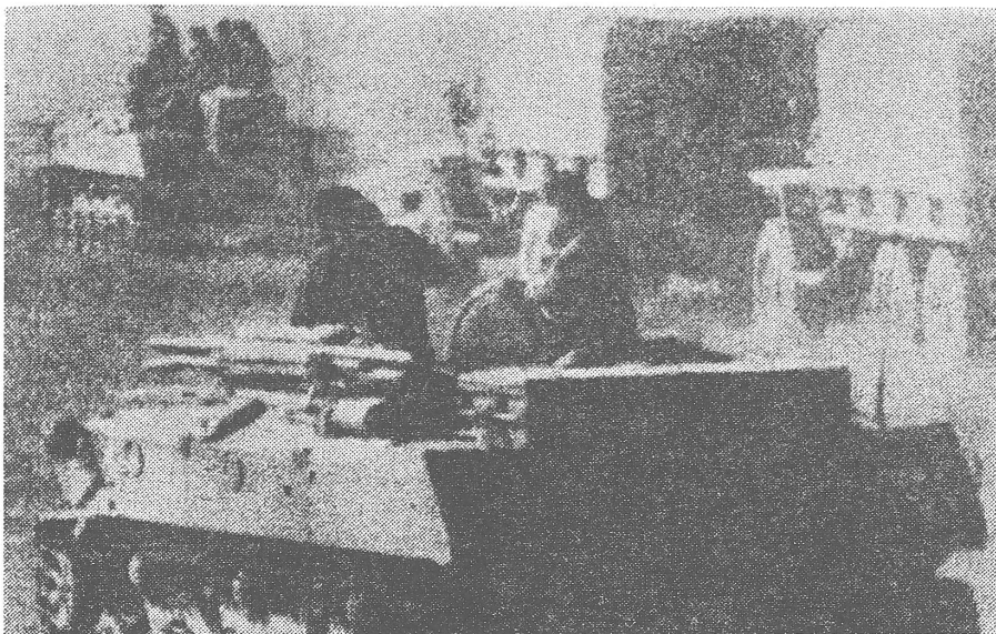
Sowjetpanzer in Kabul («Vjesnik», Zagreb).

Frage. Wenn dann statt der Olympiade bloss noch eine Spartakiade übrigbliebe, hätte die Sowjetführung in der Welt und vor dem eigenen Volk einen Prestigeverlust erlitten.