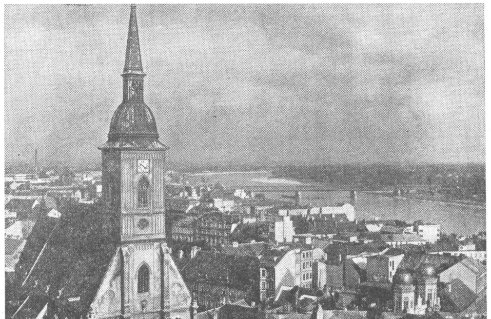
Bratislava, die slowakische Hauptstadt, ist gleichzeitig auch das Zentrum des kulturellen Lebens der ungarischen Minderheit – oder sollte es sein.

Die kulturellen Ansprüche der ungarischen Minderheit haben sich, so das Dokument, auf Folklore und übersetzte Belletristik zu beschränken.