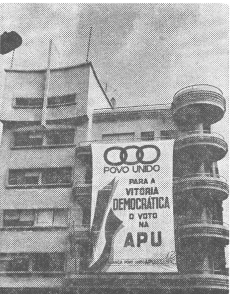
Kommunistische Parteizentrale in Lissabon 1979: Optischer Rückzug auf die Allianz der Volkseinheit (APU). Er hat sich gelohnt.