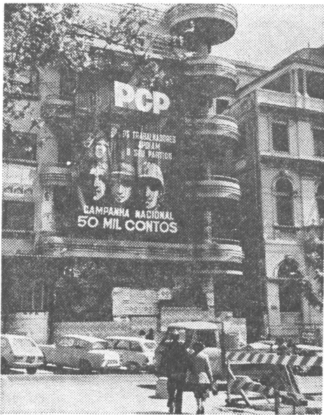
Kommunistische Parteizentrale in Lissabon 1978: Parteibezeichnung und Emblem prangen von der Fassade.

Die Demokratische Allianz hat jetzt die absolute Mehrheit im Parlament. Aber sie könnte bald einer Volksfront gegenüberstehen, die mehr darstellt als die bloße Addition von Kommunisten und Sozialisten. gn