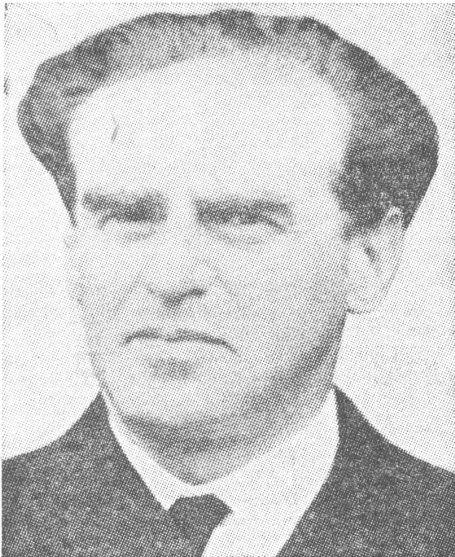
Rudolf Slansky, KP-Generalsekretär, 1952 hingerichtet, unter anderem als «Tito-Zionist».

jeder echten Verteidigung, Urteile nach Vorschrift der «Organe».