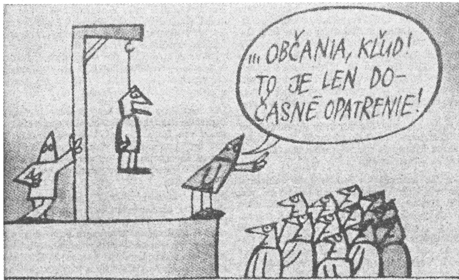
Auch der Normalisierungsprozess ist ein politischer Prozess mit «einstweiligen» Folgen für den Delinquenten: «Nur ruhig, das ist doch bloss eine provisorische Massnahme.» Diese Karikatur konnte «Rohac», Bratislava, noch am 5. 2. 1969 veröffentlichen.

ter» 212 Personen zu Gefängnisstrafen (zwischen 2 und 12 Monaten) verurteilt worden.