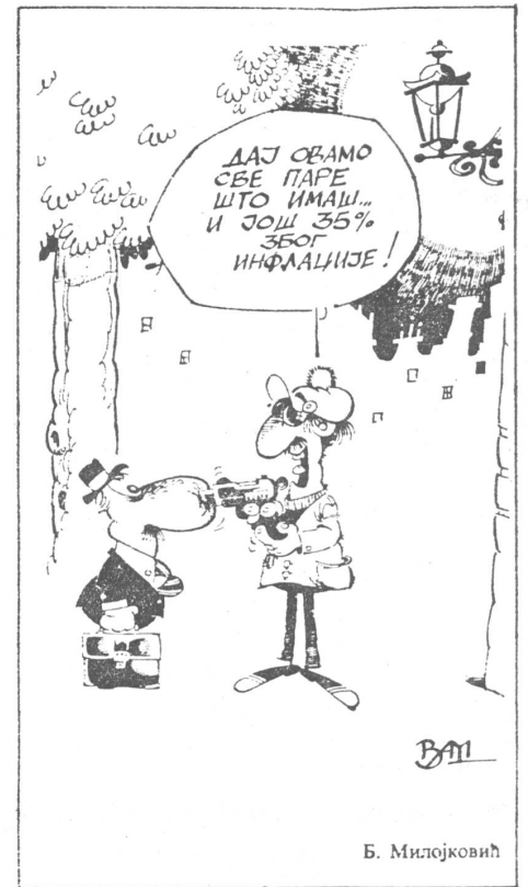
Inflationsangepasster Strassenräuber: «Gib alles her, was du an Moneten hast, und dann noch 35 Prozent als Teuerungszulage.» («Jesch», Belgrad) Eine Logik von geradezu fiskalischem Format.