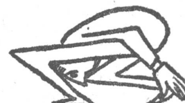
Vor dem Direktionszimmer. Karikatur aus der Betriebszeitung des metallurgischen Kombinats «Katowice».