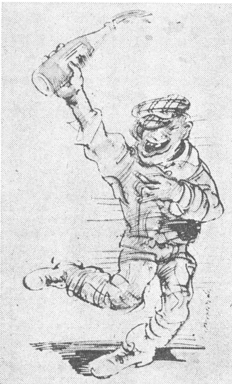
Betrunkener Arbeiter. Vignette von «Szpilki», Warschau.