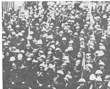
Offizielle Freundschaftskundgebung für die Sowjetunion im Stahlwerk Katowice, das sein Erz von der UdSSR geliefert erhält.