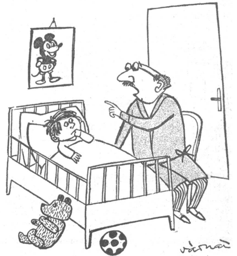
Das Gutenachtgeschichtlein: «...und plötzlich sieht der arme kleine Oberbuchhalter, wie ein grimmiger schwarzer Revisor sich anschleicht...»