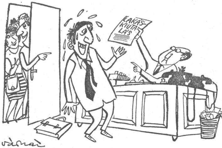
Auf dem Wohnamt. Die Wartenden hinter der Tür: «Er hat die Wohnung gekriegt, prima. Gleich trifft ihn vor Freude der Schlag, und die Wohnung ist wieder frei.»