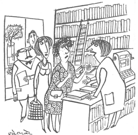
In der Buchhandlung. «Leider sind die Schulbücher vergriffen. Aber irgendwann gibt es wohl wieder einen Büchertag, und dann können Sie vielleicht welche kaufen.» (Ein Mangelwitzchen wie andere auch. Aber für den westlichen Leser informativ. Oder hätte er etwa nicht in aller Selbstverständlichkeit «gewusst», dass Schulbücher «dort» gratis sind?)