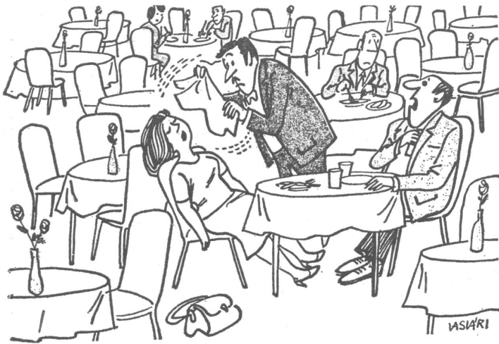
«Ja, das war halt ein Schock: sie hatte das kleine Menu bestellt, und jetzt kommen Sie und bedanken sich, als ob es das teure wäre.»