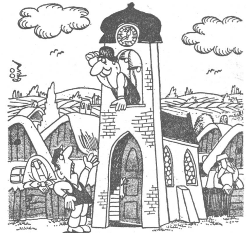
Nach der Ernte: «Und sobald du eine TV-Elite wahrnimmst, läutest du Sturm.» (Die Ergebnisse spielen keine Rolle, wohl aber ihre Präsentation.)