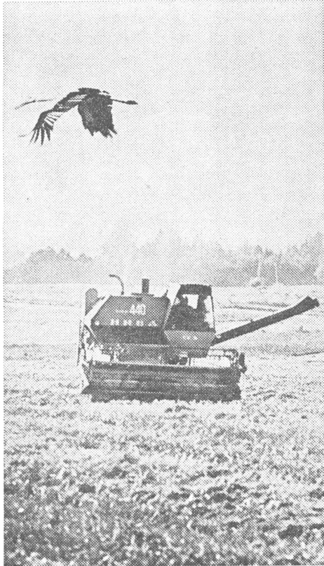
Der Kolchos «Sadala» in Südestland bietet ein stimmungsvolles Bild, aber die Stimmung bei der estnischen Bevölkerung ist mies, weil sie für Estland produzieren will und nicht für Leningrad.

Ein typisches Beispiel für sein «Taktgefühl» war sein Wirtschaftsreferat vor dem Zentralkomitee der Republik am 10. Juli (publiziert in «Rahva Haal», Tallinn, 12. 7. 1979). Statt mindestens rhetorisch der Bevölkerung seine Anteilnahme wegen der unbefriedigenden Lebensmittelversorgung zu zeigen, tadelte er sie ausgiebig wegen der Nichterfüllung des Exportplanes (zugunsten anderer Sowjetrepubliken).