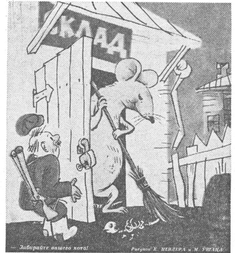
Die Ratte im Getreidelager: «Da! Ihr könnt eure Katze zusammenlesen.»