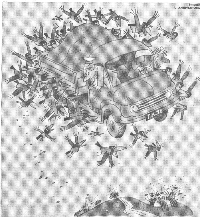
Wo die Krähen sich angewöhnt haben, die Getreideernte für sich zu beanspruchen: «Aber jetzt werden die Viecher doch richtig unverschämt — uns gleich so in ihre Nester zu tragen!»

In der Sowjetunion ist die schlechte Getreideernte von diesem Jahr durch Unwetterschäden bedingt. Nun, Schwankungen kann es geben. Aber es sind Schwankungen innerhalb permanent schlechter Ergebnisse, und diese dauerhafte Sachlage ist ihrerseits nicht natur-, sondern systembedingt. Sowjetische Karikaturisten dürfen und sollen Symptombehandlung treiben. Sie tun es in wiederkehrenden Motiven schon lange. Und sie werden es, weil das Uebel tiefer steckt, noch lange tun.