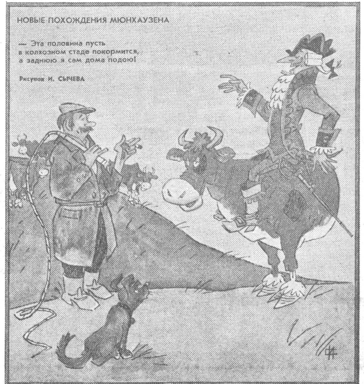
Münchhausens neue Abenteuer. «Das ist so: Diese Hälfte bringe ich zur kollektiven Weide, und die hintere Hälfte melke ich zu Hause.» Ein hübsch zugeschnittenes Exempel einer alten Thematik.