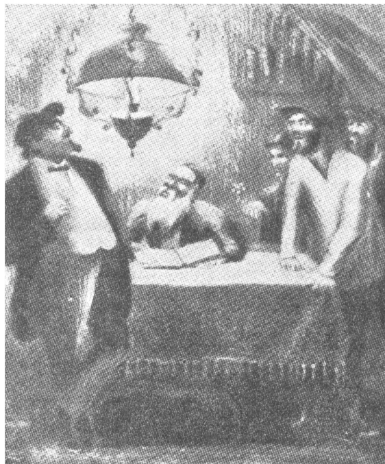
1960 erschien in Moskau ein Buch von M. I. Schachnowitsch unter dem Titel «Das reaktionäre Wesen des Judentums». Hier wurde unter anderem die nebenstehende Zeichnung von A. Kaplan reproduziert: «Gericht beim Rabbi».

Nach einer kurzen Zeit der Unterstützung für Israel, die in den Juden Russlands grosse Illusionen geweckt haben muss, «liquidierte» man das (offizielle) jüdische Antifaschistische Komitee in der UdSSR, das zuvor auch in den USA um Hilfe für seine Sache geworben hatte. Dem un-