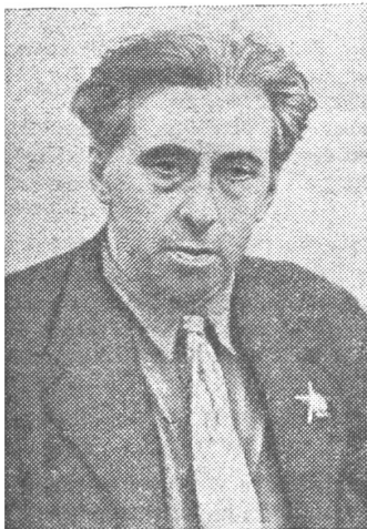
רעדע פונעם שרייבער איליא ערענבורג

Ein historisches Dokument: Ilja Ehrenburg mit Porträt und hebräisch gesetztem Beitrag auf jiddisch in einer sowjetischen Schrift.