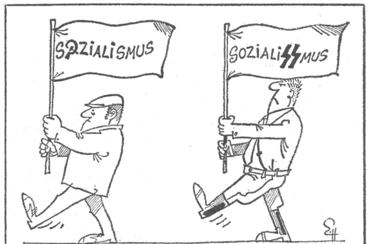
Unter Brüdern. Karikatur aus «student», Würzburg.

Es waren die Nationalsozialisten, die (in Deutschland) den 1. Mai als Tag der Arbeit zum gesetzlichen Feiertag erklärten, als welcher er bisher jede Entnazifizierung überstanden hat.