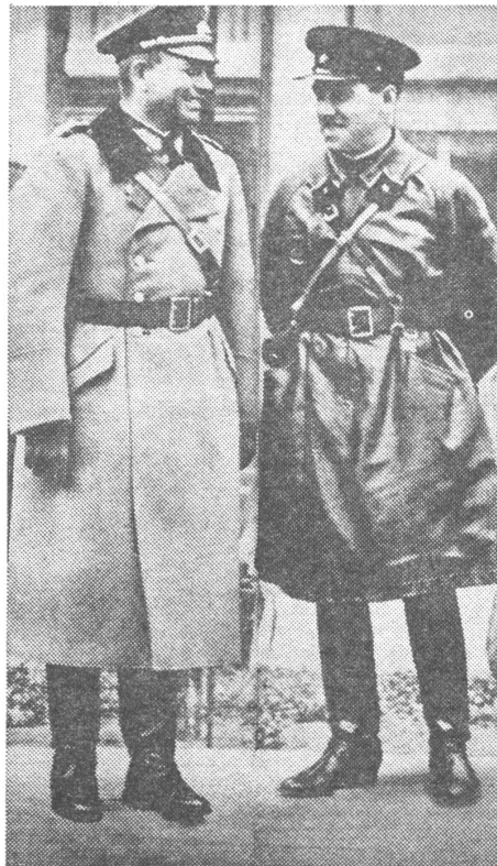
In Brest-Litowsk schloss sich die deutsch-sowjetische Zange gegen Polen. Hier begegneten einander der reichsdeutsche Panzergeneral Guderian und der sowjetische General Kriwoschin als Waffenbrüder.

Stalins Bestrebung konzentrierte sich zunächst auf die Wiederherstellung der Grenzen des zaristischen Russlands , auf die Rückgewinnung der nach dem Ersten Weltkrieg verlorenen zaristischen Gebiete. Später wollte er aber noch mehr.