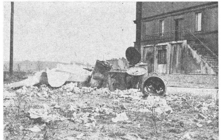
Gab es für die Studentenrevolte vom März 1968 keine andern Gründe als die «Hetze» jüdischer Intellektueller? Hier die Aussenansicht eines Studentenheimes in Gliwice 1965.

In der handfesten «nationalkommunistischen» Diktatur Rumäniens haben es alle Untertanen schwer und die Angehörigen von Minderheiten noch ein bisschen schwerer. Die Juden sind da bloss auch dabei.