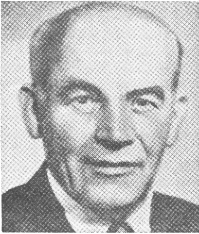
Gomulka war selber kaum Antisemit, setzte aber zwecks Krisenbehebung auf antisemitische Gefühle.

Schriftsteller, Journalisten und Wissenschaftler. Man kann ohne Uebertreibung von einem Aufstand der Intelligenzia sprechen, und er brachte das ganze Land in Bewegung. (Eine zusammenfassende Darstellung veröffentlichte unsere Zeitung in Nr. 12/1968.)