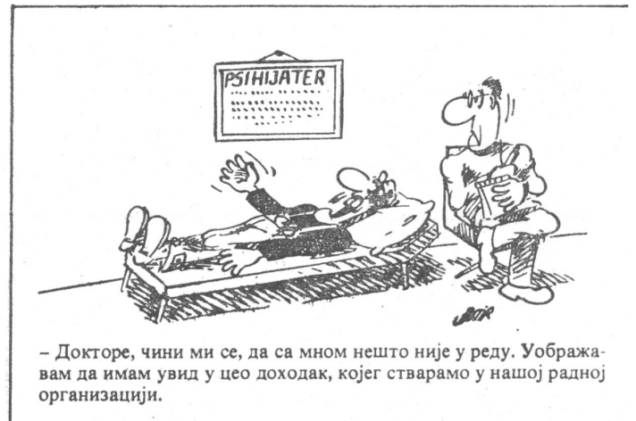
– Докторе, чини ми се, да са мнош нешто није у реду. Уображавам да имам увид у цело доходак, којег стварамо у нашој радној организацији.