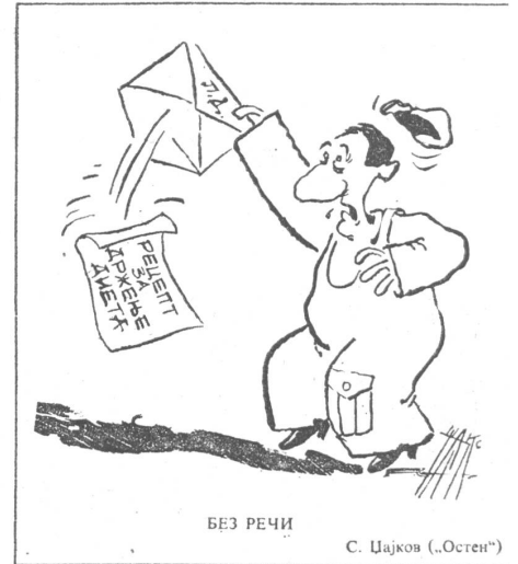
БЕЗ РЕЧИ С. Чајков („Остен“)

Jugoslawische Karikaturen über Zustände, die es eigentlich nur im Kapitalismus geben sollte.