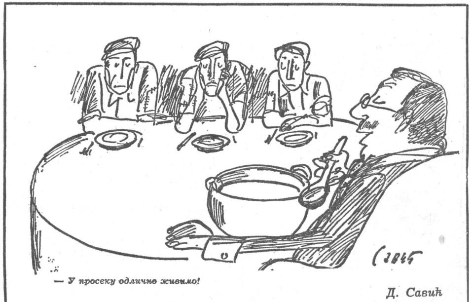
— У просеку одлично живимо!