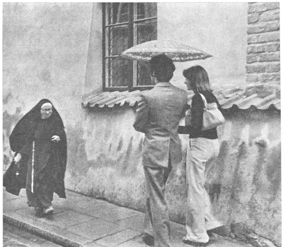
Strassenszene in Warschau. «Polska», Warschau, Nr. 5/79

Die «Autonomie» der Kirchen wird auch in Polen auf die Ausübung von Kulthandlungen beschränkt, und wie die Fachliteratur betont, gilt im Verhältnis Staat—Kirche die Suprematie des Staates, die eine neutrale Haltung gegenüber dem System niemals zulässt. (Michael T. Staszewski: «Der Staat und die Religionsgemeinschaften in den europäischen sozialistischen Staaten». Polnisch. Warschau 1976, S. 277.)