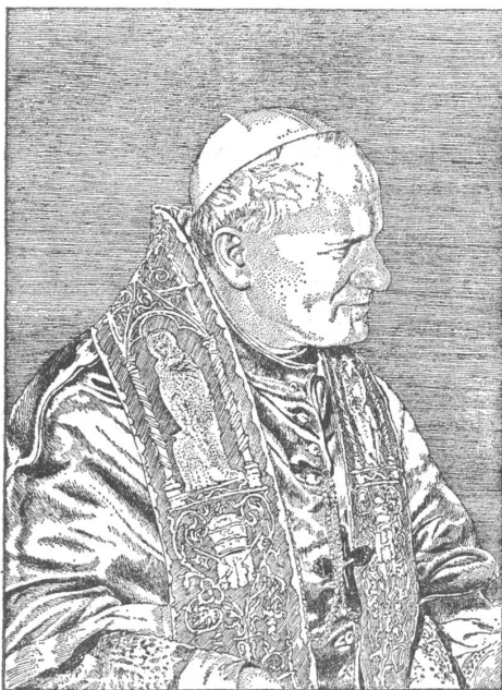
Papst Johannes Paul II. Zeichnung von Antoni Chodorowski. «Polen», Warschau, Nr. 2/79

5. Als «Kontaktstelle» zwischen Staat und Kirche gibt es auch in den Volksdemokratien — wie in der UdSSR — spezielle Staatsorgane für Kontrolle, und dies trotz konstitutionell verankerter Trennung von Staat und Kirche. Die Bekleidung kirchlicher Posten geschieht mit grober staatlicher Einmischung. Der Staat behält sich entweder die Bestätigung der Ernennung vor (Polen: Dekret vom 9. 2. 1963; Ungarn: Gesetzesverordnung Nr. 22/1957), oder er hat ein Vorschlagsrecht (Rumänien: Statut der kath. Kirche, Art. 13; Bulgarien: Gesetz über die Kulte vom