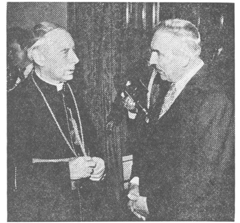
Wyszyński und Gierek 1978. Der Primas und der Parteichef trafen sich damals in – Rom.

Ab Schuljahr 1957/58 wurden eine Anzahl Schulen mit Religionsunterricht zugelassen. Das Ge-