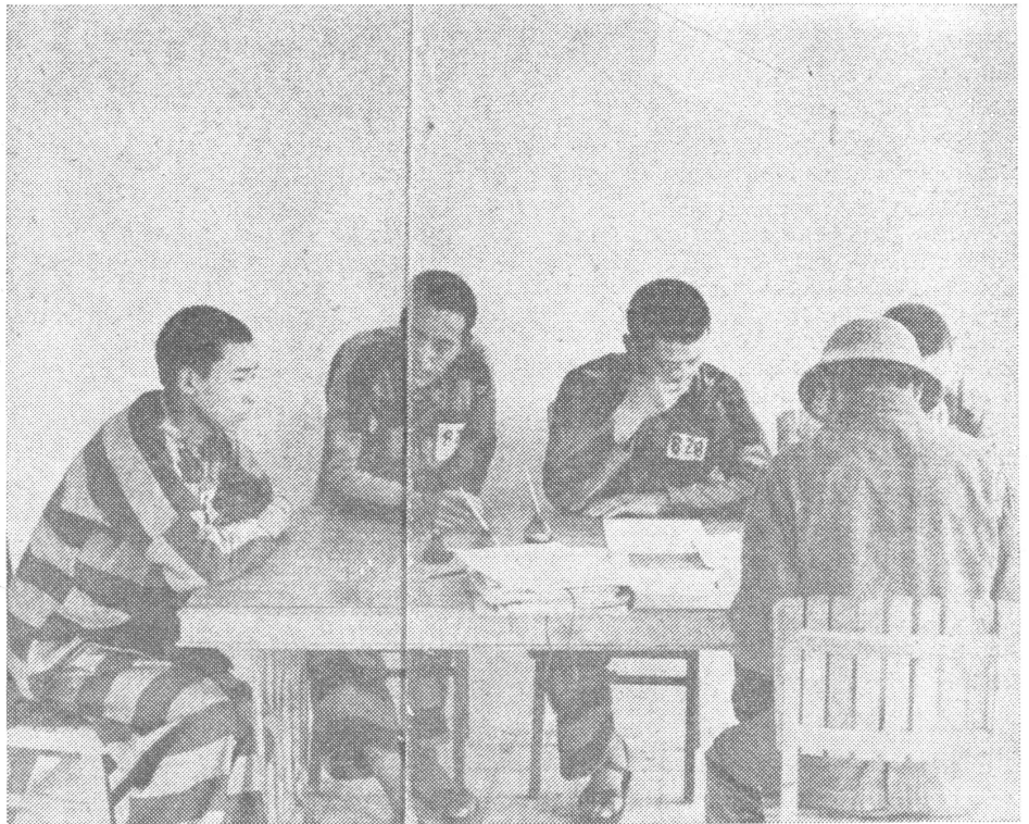
Gruppenbild der Interviewten, offenbar vor oder nach dem Gespräch, das mit jedem unter ihnen «selbstverständlich einzeln» geführt wurde.

«Dass ich nun hier sitze.» «Wissen Sie, dass Vietnam ein sozialistisches Land ist?» «Nein.» «Was glauben Sie: Ist die Sowjetunion ein Freund oder ein Feind?» Er wittert eine Falle und kriegt es mit der Angst zu tun. Aber er antwortet doch: «Ich bin ein einfacher Bauer. Die Politik hat mich nie interessiert. Woher sollte ich wissen, wer Freund ist und wer Feind?» «Warum sind Sie dann gegen Vietnam gezogen?» «Weil man hier die Hoa (Vietnam-Chinesen) verfolgt, weil ihr in China eingebrochen seid und uns Fallen aus Bambuspfeilen gestellt habt. Das hat man uns gesagt.» «Haben Sie eine solche Falle gesehen?» «Nein, aber man hat es uns gesagt.» «Wo hat man Sie gefangengenommen?» «Wir kämpften auf einem Hügel. Wir wurden eingekreist, und ich ergab mich.» «Wissen Sie, wieviele Leute in China leben?» «800 Millionen. So hörte ich vor zwei Jahren.» «Und in Vietnam?» «Das weiss ich nicht.» «Haben Sie die zerstörten Häuser gesehen?» «Ja.» «Wer hat sie zerstört?» «Ich weiss nicht — im Kampf muss man auf jedes Ziel schiessen.» «Und das gilt auch für die Artillerie?» «Gewiss.» «Wie behandelt man Sie hier?» «Ich kann nicht sagen, dass man mich schlecht behandelt, aber ich hätte drei Wünsche: Ich möchte mich sattessen, ich möchte unter einer warmen Decke schlafen, und ich möchte einen weniger harten Wächter.» «Wissen Sie, dass Sie das gleiche Essen erhalten wie Ihr Wächter?» Er sieht uns überrascht an. «Nein.» «Es ist aber so», sagt nun Oberstleutnant Vyen. «Und manchmal hat auch er Hunger.»