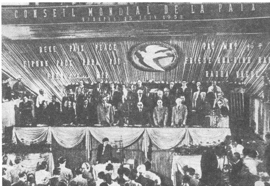
Der Weltfriedensrat versammelte sich am 15. Juni 1953 in Budapest: Die Kulissen waren immer gut präpariert.

Die meisten Aufrufe an die Weltöffentlichkeit, die wichtigsten weltweiten Kundgebungen, Konferenzen und Seminare werden den beiden Kon-