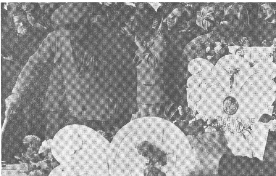
Der April-Umsturz von 1974 war völlig unblutig verlaufen. Aber vier Todesopfer forderte der Staatsstreich, den die PCP im November 1975 versuchte. Zu Grabe getragen wird hier ein Soldat in Moita südlich von Lissabon, auf den hinterrücks tödliche Schüsse abgegeben worden waren.