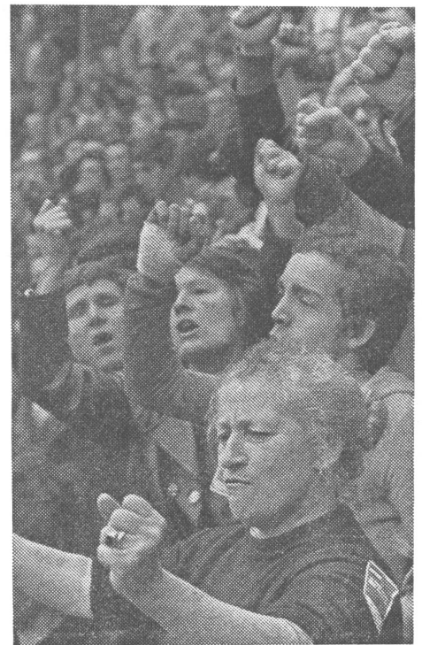
Zu PCP-Protestversammlungen wurden bisher Landarbeiter aus dem «roten» Alentejo nach Lissabon gebracht – Arbeitszeit und Transporte auf Kosten des Staates. So haben Kooperativen die Staatssubventionen zweckentfremdet.

So sehen heute die Portugiesen wenig Zukunftsaussichten, werden von ungezügelter Teuerung,