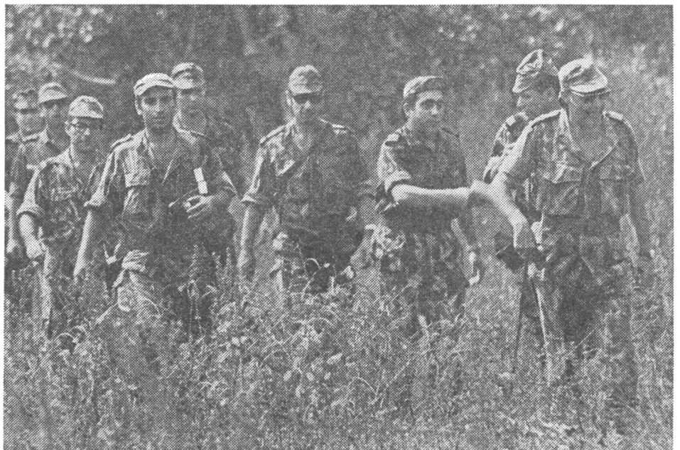
General Spínola (ganz rechts) in Guinea-Bissau.

Die Sozialisten von Mario Soares, die zweimal