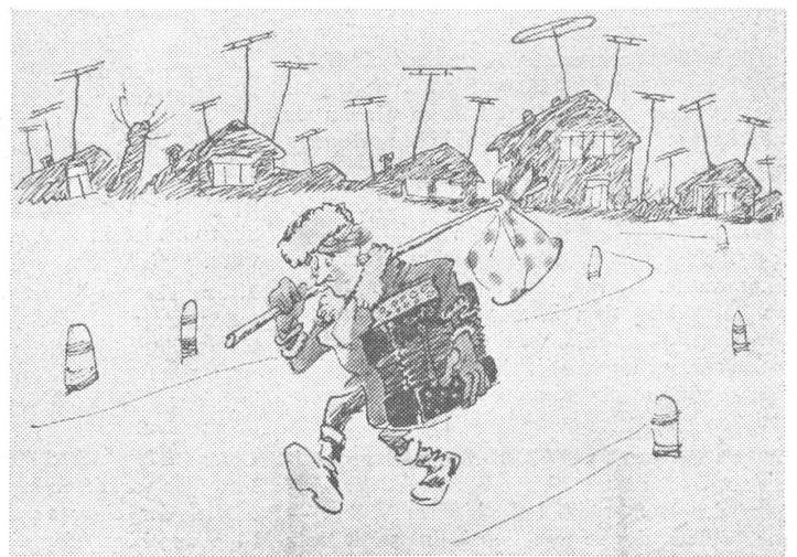
Ein Bild ohne Worte von interessantem Stimmungsgehalt. Der Musiker zieht betrübt ab, weil das TV-ausgestattete Dorf seiner nicht mehr bedarf. Eine unbeschwert positive Karikatur zum glorreichen Triumph der Technik? Oder ist ein erster Ansatz von Wehmut auch schon dabei?