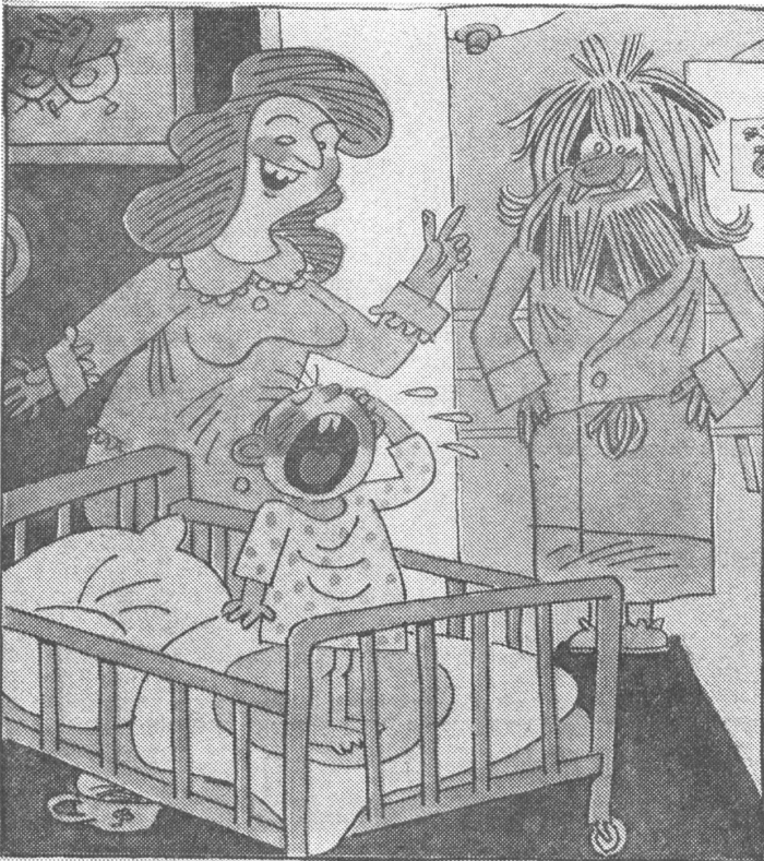
Die unmögliche Montur der heutigen Eltern: «Aber Petja, das ist doch bloss der Papi, der dir gute Nacht sagen kommt.»