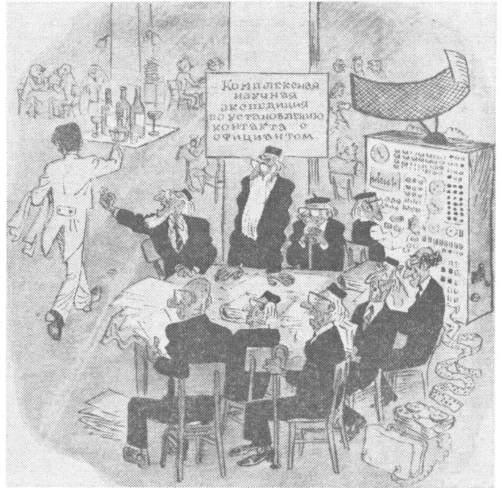
Das Gremium, nach welchem ein echter Bedarf besteht: «Komplexe wissenschaftliche Expedition zur Herstellung von Kontakten mit dem Bedienungspersonal.»