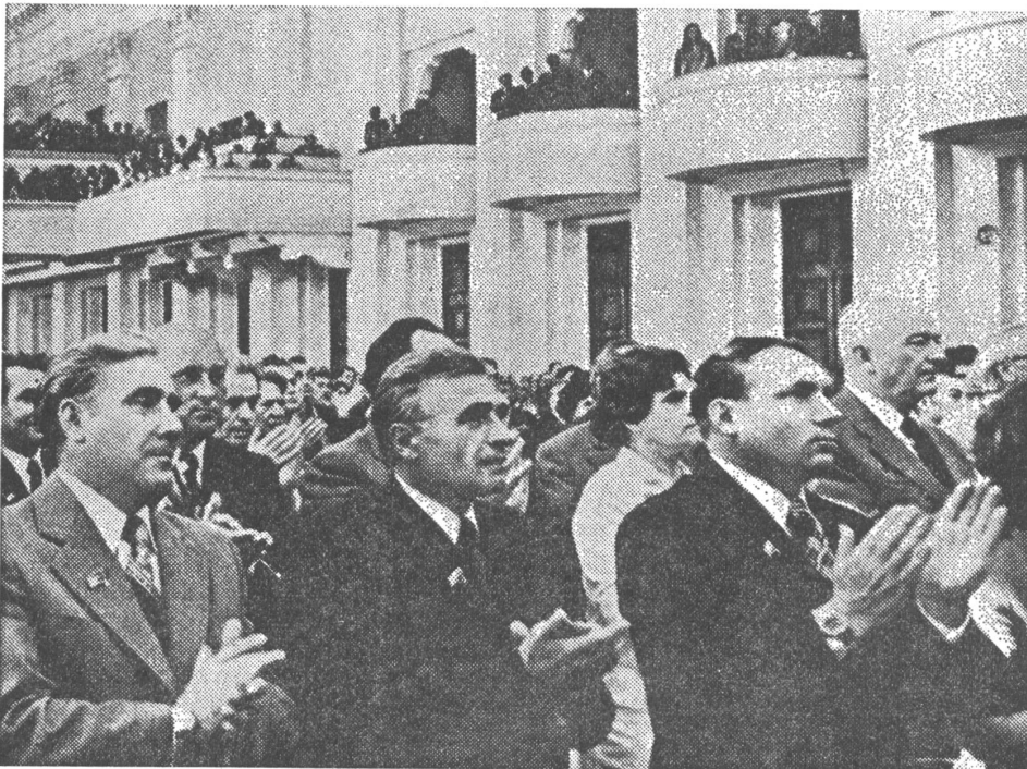
So hatte der Oberste Sowjet 1977 den Parteichef Leonid Breschnew zum Vorsitzenden des Präsidiums des Obersten Sowjets, also zum Staatschef, gewählt.

In der Gewissheit unangenehmer Folgen für sich selbst nehmen es in der UdSSR immer mehr Leute auf sich, dem Land und der Welt vor Augen zu führen, dass Wahlen ohne Alternativmöglichkeit ihren Namen nicht verdienen. Dort merken die Leute, was sie nicht haben. Und wir im Westen merken nicht, was wir haben. cb