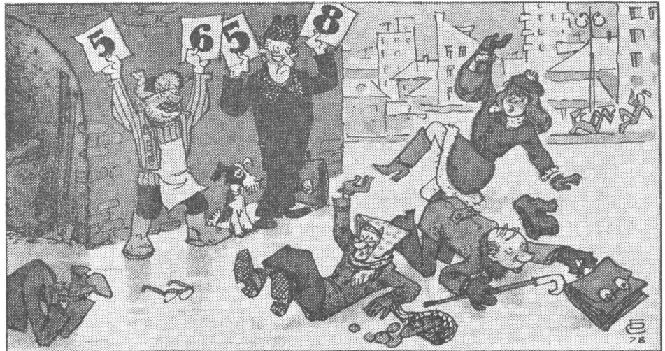
Die Hausverwaltung hat eine Jury bestellt. («Krokodil», Moskau, Nr. 2/79)

Die Moskauer Zeitschrift «Schurnalist» (Nr. 1/79) zeigt sich etwas irritiert. In der Bergbaustadt Nischnij Tagil (Ural) wurde ein Arbeiter für seine Vorbildlichkeit ausgezeichnet. Er bestieg vor versammelter Belegschaft das Ehrenpodest, um seine Medaille in Empfang zu nehmen. Und jedermann konnte sehen, dass ihm eine Wodka-Flasche zur Tasche herausragte.