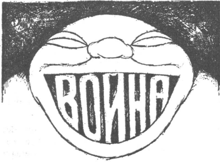
Das diplomatische Lächeln Pekings in Aktion. China bleckt die Zähne zum «KRIEG» («Narodna armija», bulgarische Armeezeitung, Sofia, 20. 2. 79)