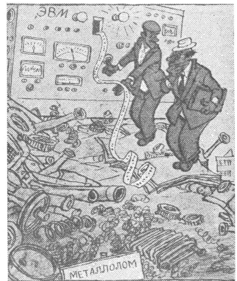
Der Computer auf dem Abfallhaufen. Oben: «Was kriegen wir wohl für unser Altmetall?» Unten: «Das können wir gleich mal berechnen.» («Krokodil», Moskau, 18/78)