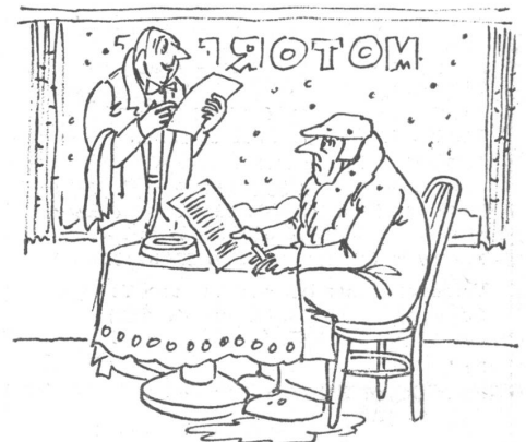
Bedienung im ungeheizten Restaurant: «Also Sie sind Autofahrer; da wollen Sie bestimmt keinen Alkohol. Warme Speisen und Getränke dürften Sie schon nehmen, nur sind wir da momentan gerade ausverkauft. Aber ich kann Ihnen unsere Glace-Coupees empfehlen; die sind wirklich ausgezeichnet.» (Nr. 5/79)