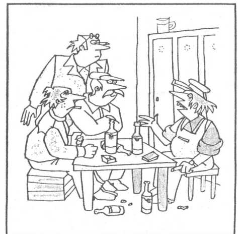
«Jetzt brauchen wir noch den Stempel zur Bestätigung dieser Ueberstunde.» (Nr. 4/79)