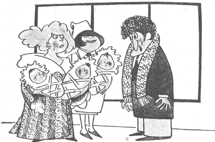
«Eine schöne Bescherung! Wo soll ich denn so viel Protektion nehmen, wo?» (Nr. 5/79)