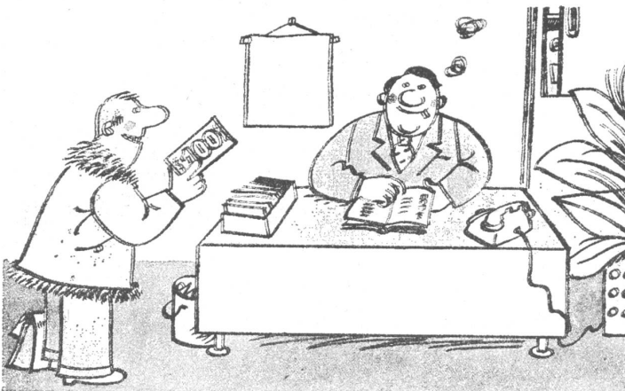
«Und wegen Ihrer Arbeit mit meiner richtigen Placierung auf der Warteliste: Darf ich Ihnen einen kleinen Vorschuss überreichen?» (Nr. 2/79)