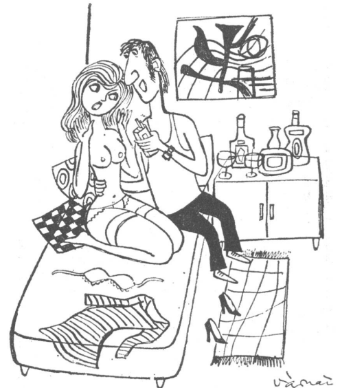
Die Tugendhafte: «Nein, lassen Sie das, mein Mann hat es nicht gern, wenn ich rauche...» (23. 11. 78)