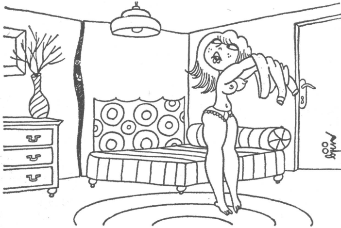
Modern gebautes Haus: «Pfui, schämt euch! Ich weiss genau, dass ihr guckt!» (14. 9. 78)