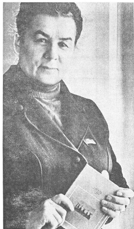
Wo die Zensur gewollt ist, macht das Monopol nichts. Diese sowjetische Deputierte hat das Buch, das man für sie als richtig befunden hat.

Die Folgen dieser Entwicklung liegen auf der Hand: Der in seiner Existenz real gefährdete Buchhandel wird künftig den Verkaufspreis eines Buches als Richtpreis betrachten müssen, der für kurze Zeit nach Erscheinen des Buches gültig ist. Wenn das Buch nicht innerhalb einiger Monate verkauft ist, muss es zu herabgesetzten Preisen liquidiert werden. Wird das betreffende Buch nach dieser Zeit von einem Kunden verlangt, muss es als Einzelbestellung behandelt werden, wofür der Buchhändler einen Zuschlag von Fr. 5.— bis Fr. 20.— wird erheben müssen. Diese