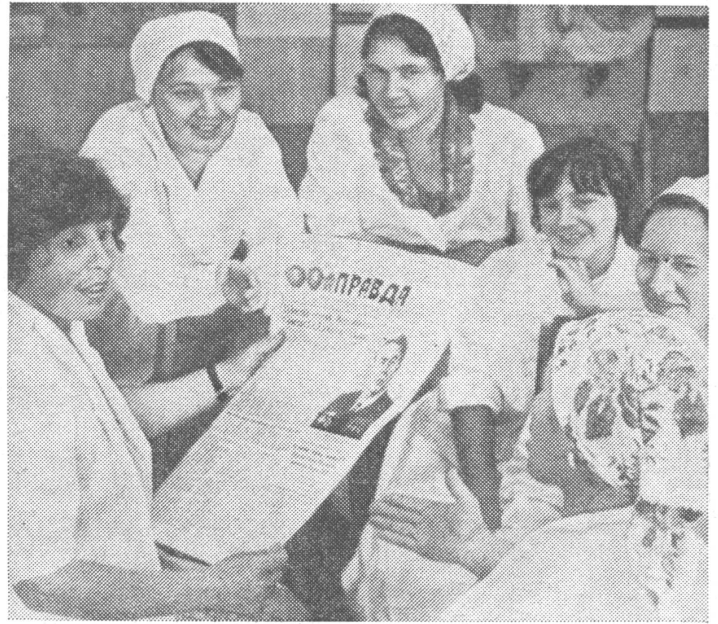
Bild aus dem Buch «Kommunisty Semidestjatyč» (Kommunisten in den siebziger Jahren), Moskau 1978.

sekretär. Handelt es sich freilich um ein Unternehmen oder eine Institution von gesamtsowjetischem Rang, wird als Vortragender ein Mitglied des lettischen Zentralkomitees delegiert.