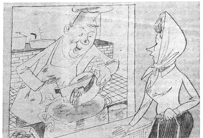
Preisreduktion (wegen schlechter Qualität) um zehn Prozent: «Was tun Sie denn da?» – «Ich schneide doch die zehn Prozent ab!» («Krokodil», Moskau)