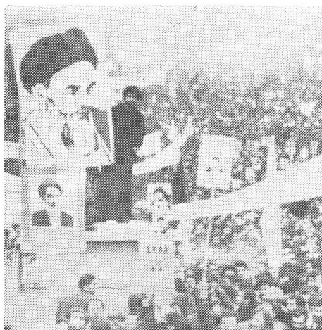
Demonstration in Teheran.

Seit fünf Jahren stützt sich die offizielle Politik der Tudeh-Partei auf eine Konvergenztheorie, die als «Bildung einer monolithischen Front gegen das bestehende Regime» vorgestellt wird. So verkündet es auch ein Programm von 1973, das seither von Radio Moskau wiederholt und ausdrücklich unterstützt worden ist. Es proklamiert die Vereinbarkeit von Marxismus und Islam, und