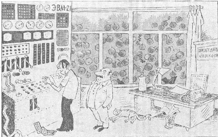
Im modern eingerichteten Büro des Kolchosvorsitzenden: «Na, dann soll uns der Computer einmal zusammenrechnen, wieviel Tonnen Äpfel wir kriegen.»

Zu unserem Beitrag auf Seite 6 noch einige Landwirtschaftskarikaturen aus «Krokodil», Moskau