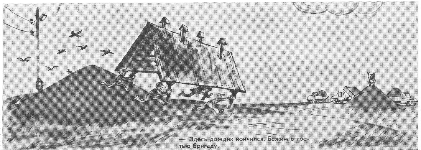
— Здесь дождик пончился. Бежим в третью бригаду.