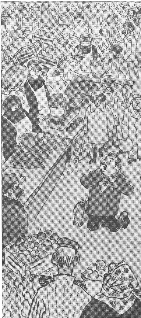
Wenn die Bauern die Produkte ihrer Nebenwirtschaft in der Stadt auf dem freien Kolchosmarkt verkaufen, statt auf den Kollektivfeldern zu arbeiten: «Das ist wieder unser Brigadeführer, der seine Leute bittet, zum Ernteeinsatz zurückzukommen.» («Krokodil», Moskau, Nr. 30/77)

«Von den 28 Millionen in der Landwirtschaft beschäftigten Personen arbeiten (nach Tagewerken gerechnet?; Anm.) 4,5 Millionen in den privaten Hoflandbetrieben. Das sind weniger als ein Sechstel der Gesamtzahl der Beschäftigten. Dieser knappe Sechstel der Beschäftigten erzeugt 28%, d. h. fast ein Drittel, der gesamten landwirtschaftlichen Produktion.» Eine einfache Rechnung ergibt, dass demzufolge die Produktivität