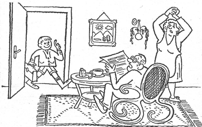
Vor zehn Jahren erschütterten die aus der Schule heimkommenden Kinder in der CSSR ihre Eltern mit ganz andern Sachen: «Mama, Papa, heute haben wir den Schuldirektor davon überzeugt, dass er seinen Rücktritt nehmen müsse.» Eine «Dikobraz»-Karikatur von 1967.

«Augenblick mal», unterbrach der Vater. «Bring mir bitte die Dinge nicht durcheinander. Und du» — so sprach er wieder seinem Sohn zu — «pass einmal genau auf: Du bist jetzt in einer ganz bestimmten Etappe deines Lebens, einer wichtigen. Und in jeder Etappe sind Priori... äh, und in dieser Etappe kommt es für dich vor allem darauf an, dass du lernst. Das ist es, was für dich zählt. Und damit basta! Und was jemand