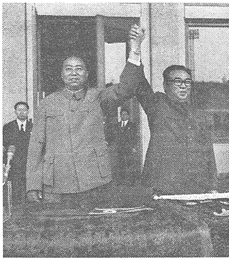
Zurzeit optiert Nordkorea eindeutig mehr für China als für die Sowjetunion. Am 7. 5. 1978 wurde Hua Kuo-feng in Pjöngjang vom nordkoreanischen Präsidenten Kim Ir Sen gross empfangen.

Universität Stanford. Das Programm soll 1979 ausgebaut werden.