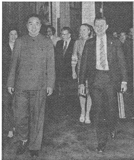
Der zweite Anlauf nach 1972: Parteichef Hua Guofeng empfängt Zbigniew Brzezinski, den Sicherheitsberater des amerikanischen Präsidenten, am 22. 5. 1978.

Dieser Besuch markierte nicht nur eine Aenderung im Verhalten der USA zu China, sondern widerspiegelte überhaupt neue globalstrategische Überlegungen, zu denen die Carter-Administration allmählich gelangte. Insbesondere gehörte dazu, China nicht länger als «Karte» auf dem amerikanisch-sowjetischen Verhandlungstisch zu betrachten, sondern vielmehr als De-facto-Verbündeten im Kampf um gemeinsame Interessen. Diesmal gab es keine so oder anders auslegbaren «Signale», sondern erfrischenden Klartext. Während seines Besuches sagte Brzezinski (alle Zitate nach «Peking Rundschau»):