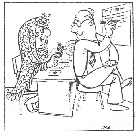
(Karikaturen aus «Sowjetskaja Latwija», Riga, 27. 8. 1978.)