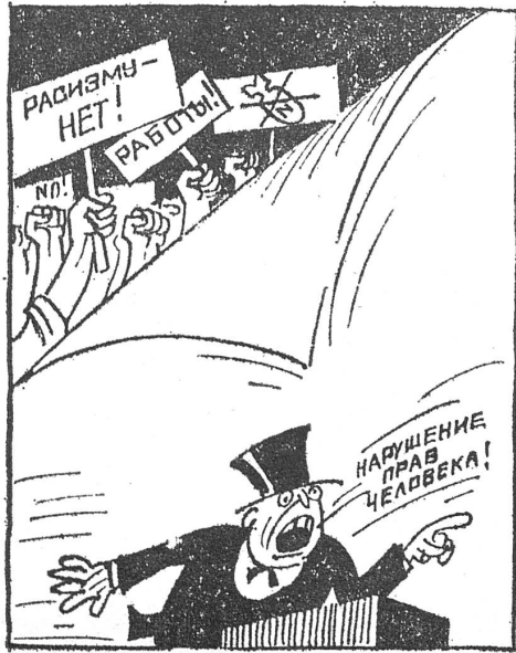
«Ablenkungsmanöver» lautet die Legende zu dieser Karikatur von «Prawda Wostoka» (17. 8. 1978). Der amerikanische Aufruf zur «Verteidigung der Menschenrechte» geschieht vor dem Hintergrund von Protestdemonstrationen gegen Rassismus und für Arbeit.

Natürlich können die Sowjets jederzeit Exempel statuieren, um den Westen zur Resignation zu bringen. Aber insgesamt ist andersherum zu fragen: Fördert man die Menschenrechte, wenn man auf ihre Verletzung nicht mehr reagiert? Wie Menschenrechte in der west-östlichen Zusammenarbeit zu behandeln sind, ist debattabel. Werden sie aber nicht behandelt, so ist das keine Anpassung der Wünsche an die sowjetische Realität, sondern eine Anpassung der Realität an die sowjetischen Wünsche.