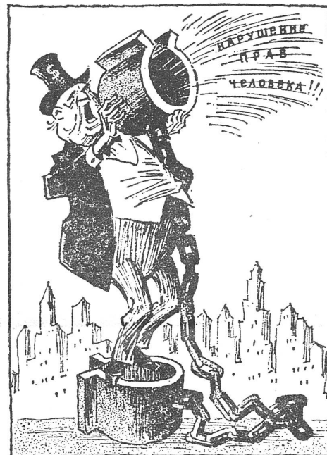
Eine Karikatur der «Prawda» vom 19. 7. 1978: Onkel Sam schreit über das Megaphon amerikanischer Ketten: «Verletzung der Menschenrechte». Die Bildlegende lautet: «Sprachrohr und Piedestal in Verteidigung der Menschenrechte.»

«Auszüge aus einem längeren Gespräch haben einen unrichtigen Eindruck von meinen Ansichten über den Prozess Anatolij Schtscharanskij erweckt.