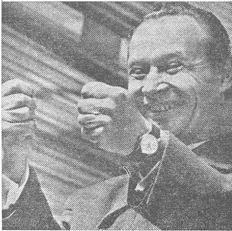
Symbol der damaligen Hoffnung: Alexander Dubček 1968.

Ministern im Februar 1948 war die Verfassung de facto ausser Kraft gesetzt. Gottwald übernahm die Staatsgewalt im Namen des Volkes gegen das Volk.