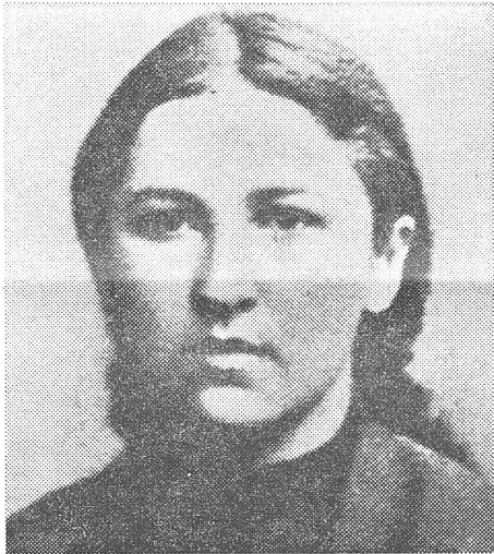
Vera Sassulitsch, 1849—1919.

«Ausgangspunkt des Streites waren Meinungsverschiedenheiten bezüglich der besten Form der Parteiorganisation, die am Kongress 1903 ausgebrochen waren. Lenin verfiel einem strikten Zentralismus und diktatorische Rechte für das Zentralkomitee, während Axelrod und seine Freunde mehr Raum für die Tätigkeit der lokalen Komitees offenlassen wollen... Im Verlauf der Auseinandersetzung entwickelten sich auch andere faktische Meinungsverschiedenheiten. Der organisatorische Streit wurde durch