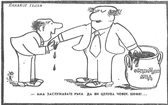
Beim Honigtopf des gesellschaftlichen Eigentums: «Ihre Hand ist so verdienstvoll, Chef, dass ich sie einfach küssen muss.» (26. 5. 1978)