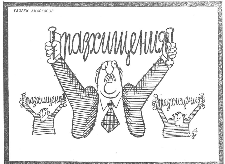
Massensport. (Der Expander heisst «Verschwendung».) (26. 5. 1978)