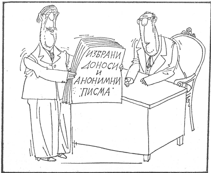
Übergabe der «Ausgewählten Werke und anonyme Briefe» an den Verleger: «Gib das heraus, damit man nicht meint, mein Leben sei leer verlaufen.» (16. 6. 1978)