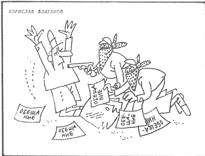
Ein Funktionär gerät unter die Räuber: «Verschont mich, ich habe nichts als meine nackten Versprechungen.» (16. 6. 1978)