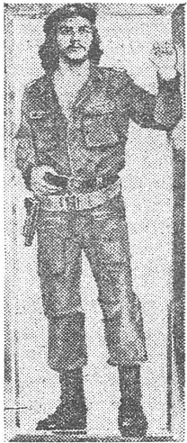
Das unversehrte Heldenbild von Che Guevara in einer Kunstbesprechung von «Prawda Ukrainy» vom 31. 5. 1978: «Dieser legendäre Held erfüllt die Ideale des Internationalismus. (...) Er tritt in seiner ganzen Größe aus dem Rahmen.» Gewidmet ist das Bild dem Jugendfestival von Havanna

sten faschistisch zu nennen (wann beginnt der Westen eigentlich damit, den politischen Krieg ebenfalls semantisch zu führen?), ist dieses vorsorgliche Sperrfeuer bemerkenswert. Effektiv stellt es ja die Abwehr gegen eine Anklage dar, die gar nie erhoben wurde. Anscheinend hat man im Kreml Mühe zu glauben, dass der westliche Gegner tatsächlich so harmlos ist, die Gelegenheit zu verpassen, zum allermindesten auf die Affinität hinzuweisen.