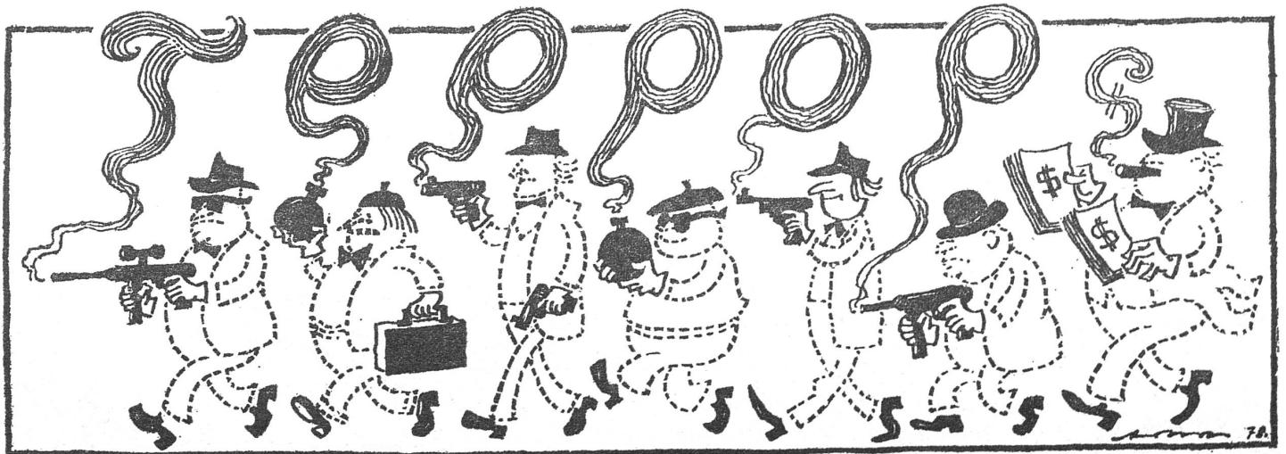
Was in Italien nicht sichtbar wurde (nämlich dass die Terroristen der Roten Brigaden von den US-Kapitalisten gekauft sind!)

Die Auffassung von der «legitimen Gegengewalt» gegen die «legale Repression» ist heute verbreite-