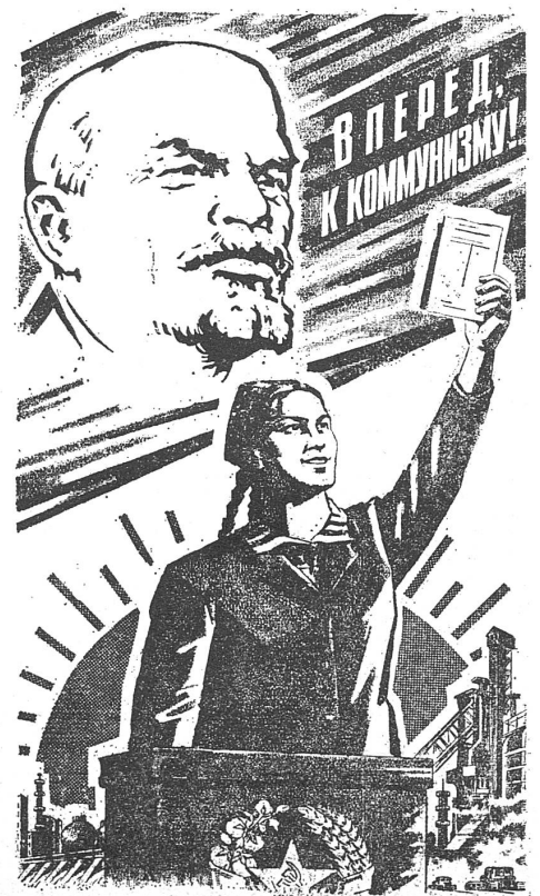
Wenn das nicht nationale Kultur der Tadschiken ist! Wahlinsert aus «Kommunist Tadschikistana», Duschanbe.

Das ist zum Beispiel im Falle von Kasachstan gut zu sehen. Auf dem Gebiet dieser Unionsrepublik ging die Geburtenzahl zwischen 1960 und 1970 von 37,2 auf 23,4 Promille zurück. Die Kasachen im ethnischen Sinne des Wortes hatten aber in diesem Zeitraum eine Geburtenrate von durchschnittlich 41,2 Promille. Die tiefere Kennziffer im territorialen Rahmen und ihr auffälliges Absinken innerhalb von zehn Jahren sind also auf Zuwanderung zurückzuführen. Tatsächlich fand sie ab 1960 auf Geheiss Moskaus in grossem Ausmass statt. Zwecks Neulandgewinnung