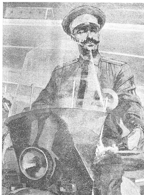
«Der Ordnungshüter». Gemälde des tadschikischen Malers I. Lissikow.

(Beim Ausfüllen sowjetischer Fragebogen sollte man bei der Frage nach der Nationalität eigentlich angeben, ob man Jude oder Jurassier ist, Alemanne oder Rätier oder was man sonst nicht weiss. Es spielt auch keine Rolle, weil die Antwort [wie bei den sowjetischen Volkszählungen] ohnehin dem persönlichen Ermessen anheimgestellt ist. Es kann sich also jeder als Jude ausgeben – wenn er sich traut.)