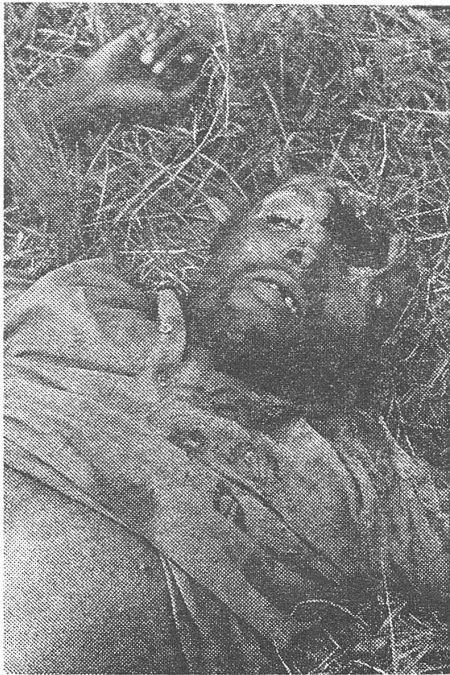
Toter in Rhodesien.

Laszlo Revesz zum ungleichgewichtigen Zuwachs der Sowjetbevölkerung