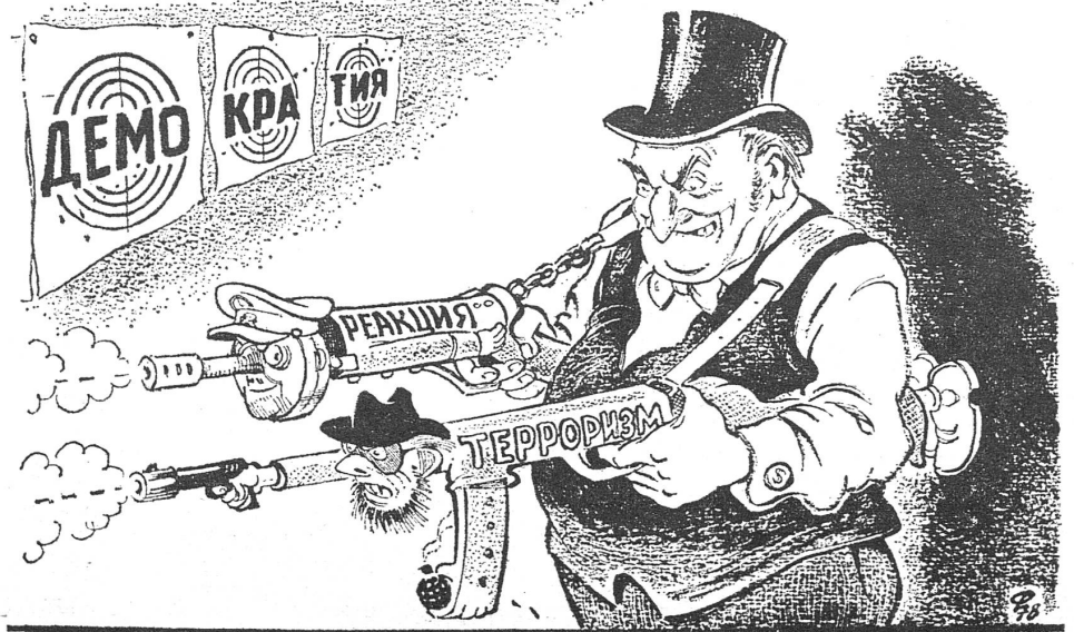
Der «Terrorismus» neben der bewährten «Reaktion» als neue Waffe des Kapitalisten in seinen Schiessübungen auf die «Demokratie». («Prawda», Moskau, 19. 5. 1978)

der DC noch zwischen den Parlamentsparteien um sich. Der Dialog zwischen der DC und den Kommunisten kann auch ohne Moro fortgesetzt werden, jedoch auf der durch die Hilfe Moros geschaffenen institutionellen Grundlage. Die ‚Moro-Aktion‘ der Anhänger der Gewalt führte nicht zum Ziel. Es wäre jedoch voreilig zu behaupten, dass dieses tragische Fiasko unbedingt zum Untergang des Terrorismus führen werde... Eine diesbezügliche beruhigende Antwort gibt es vorläufig nicht. Kommt ein weiterer, besonnener Fortschritt auf dem Wege von Kompromissen oder aber werden die Ergebnisse einer drei Jahrzehnte lang währenden demokratischen Entfaltung durch (institutionalisierte) politische Gewalt einfach hinweggefegt?»