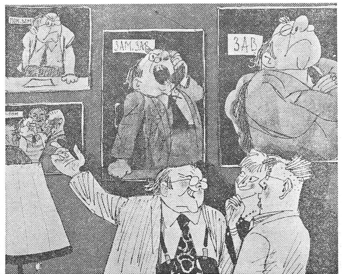
Die kleinen Diktatoren in «Krokodil»-Karikaturen. Links die Türe zum Chef: «Gestatten Sie?» — Rechts die eigene Karriere in der eigenen Bildgalerie: «Hier seht ihr mich, wie ich noch ein ganz kleiner Chef war.»