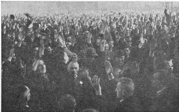
Prag 1948: Die kommunistisch gelenkten Betriebsräte proklamierten sich als Gesamtheit der Werktätigen und liessen ihre (von wem gewählten?) Delegierten an Kongressen Beschlüsse fassen.

Im Mai haben dann die Unruhen in Paris den neuartigen, unerhört tiefen Generationenkonflikt sichtbar gemacht, der zugleich die Probleme unverdauten Wohlstandes, überhitzten technischen Fortschrittes und mangelnder internationaler Solidarität freilegte. Die Erscheinung der Neuen Linken, die sich bis in den Terrorismus verästelte, ist weder materiell verkräftet noch geistig bewältigt.