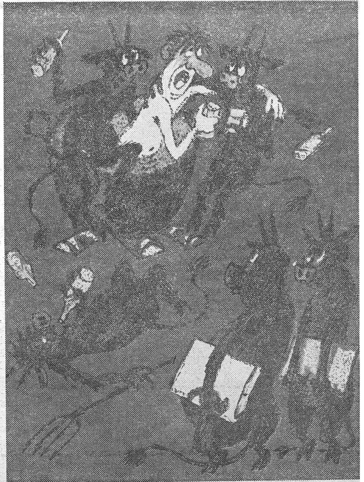
Rechts: Und warum soll es in jenem bewussten Betrieb anders sein? «Der Kerl trinkt uns schon die dritte Brigade unter den Tisch. Am besten geben wir ihm eine gute Charakteristik und spedieren ihn ins Paradies.» (Nr. 22/1977)