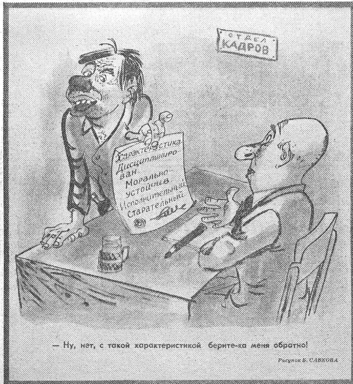
— Ну, нет, с такой характеристикой берите-ка меня обратно!