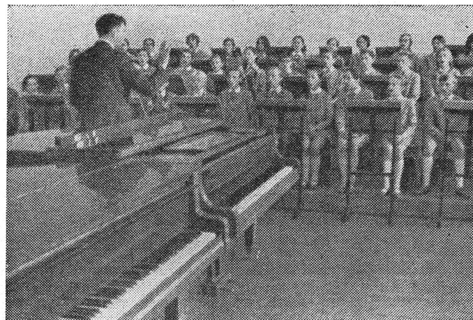
Schule in Vilnius/ (Wilna). (Aus dem Buch «Litauische Sozialistische Sowjetrepublik», Moskau 1972.) Patriotische Lieder?

Nachdem Suslow den Apparat genügend von Litauern und andern unzuverlässigen Elementen gesäubert hatte, konnte er 1946 seine Funktionen an Leute abtreten, welche die Befriedungsaktion in seinem Sinne weiterführten.