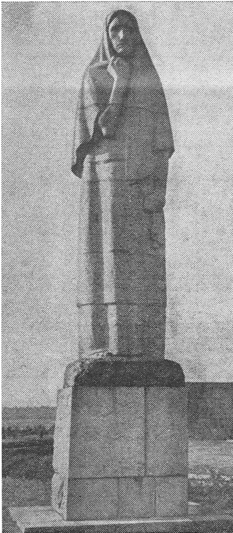
Litauisches Mahnmahl an den Krieg und Gedenkfriedhof in Kaunas. Aber die litauischen Partisanen, die den Kampf gegen die Deutschen überlebten, wurden danach auch von den sowjetischen Okkupanten als Feinde bekämpft und vernichtet.

«Varpas» hält solche Begehren insofern für realistisch, als sie einen Transformationsprozess in Gang bringen könnten; warum müsse das, was in Spanien möglich geworden sei, in der Sowjetunion unmöglich bleiben? Gewisse Fortschritte seien schon festzustellen: Es komme nicht mehr zu Massenverhaftungen von Schriftstellern, Wissenschaftlern und Studenten, und wenn die Behörden bisher z. B. ausnahmslos alle Bezüger der