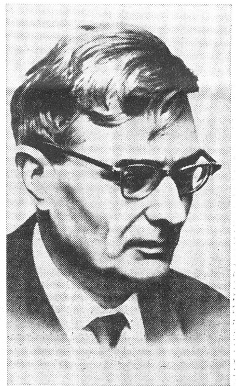
Michail Suslow ist im sowjetischen Politbüro für die Beziehungen zu den Bruderparteiern zuständig und gilt als graue Eminenz der sowjetischen Aussenpolitik. Westliche Beobachter halten ihn für den Wortführer des «konservativen» Parteiflügels, für einen stalinistisch erzogenen Grosspapa (er ist Jahrgang 1902), der mit den modernen Tendenzen halt ein bisschen überfordert sei. Aber wie unser Bericht zeigt, ist Suslow, den man früher den «Chefideologen» der Partei nannte, keineswegs nur ein ideologisch verknorrter Bürokrat. Er war seinerzeit Initiator von Verbrechen jenes Typus, für die man am Nürnberger Prozess die Höchststrafe aussprach. Er spielte in Litauen die gleiche Rolle, die Heydrich unter Hitler als Reichsprotector in der Tschechoslowakei gespielt hatte.