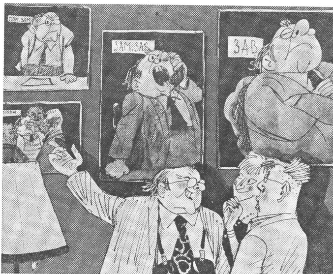
Die eigene Karriere im Bild:

Wie schon erwähnt, wurde die Sozialversicherung in allen Ostblockstaaten stufenweise eingeführt. Die Ausdehnung der Sozialversicherung auf die Kolchosbauern und die Mitglieder der wenigen anderen Genossenschaften erfolgte erst in den sechziger Jahren. Die Altersrente für die Arbeiter der privilegierten Industriebranchen führte der Staat 1928 ein, und anschliessend wurde sie stufenweise auf alle Arbeiter und Angestellten ausgedehnt. Erst 1964 wurden auch die Kolchosbauern rentenberechtigt. Nach dieser Reform erhielten zum Beispiel 1974 rund 44 Millionen Menschen (von einer Gesamtzahl von über 250