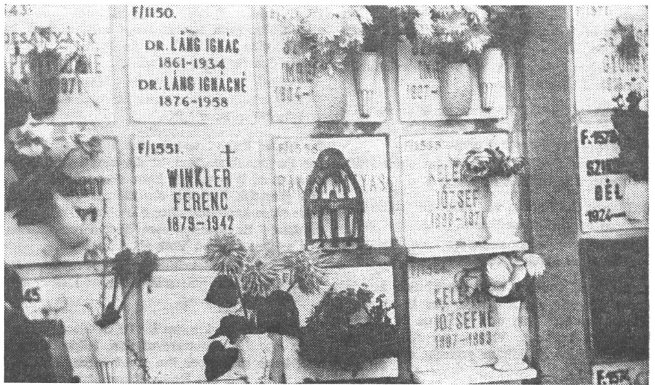
Der Grabstein für Rakosi (mittlere Reihe, dritte Tafel von links) auf dem Friedhof «Farkasret» in Budapest, wo die Asche des exilierten Diktators auf Wunsch der Sowjets beigesetzt wurde.

3. Denken Sie an die Rakosi-Aera? Rakosi hat