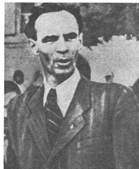
Laszlo Rajk, von Rakosi 1949 mit jenen Methoden liquidiert, die er als Innenminister selber für ihn praktiziert hatte.