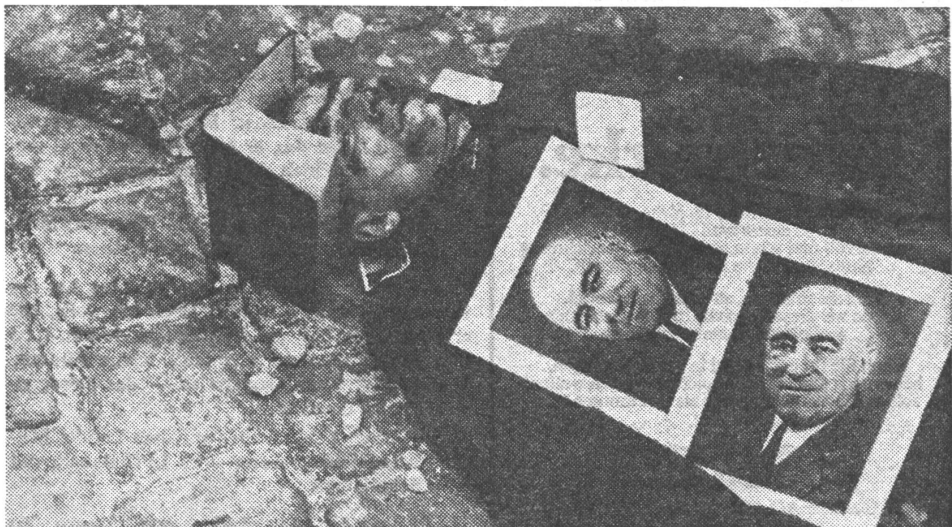
Die Volksgefühle für Rakosi zeigten sich beim Volksaufstand von 1956. Erschlagener Sicherheitsbeamte, übersät mit Rakosi-Bildern.