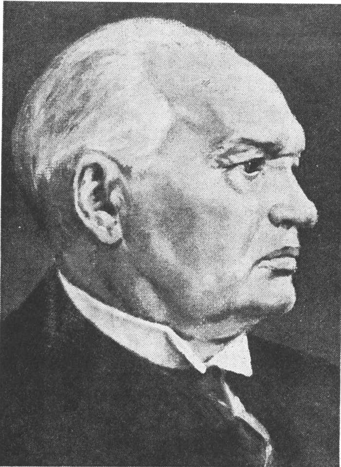
Konstantin Päts und erster Brief mit Fingerabdruck.

Infolge meines Greisenalters und der unbeschreiblich schweren Lebensumstände hat sich mein Gesundheitszustand hier sehr verschlechtert. Es ist schwer, alles zu schildern, wie man hier Gewalt gegen mich angewandt hat. Man hat mir alles fortgenommen, was ich an eigenen